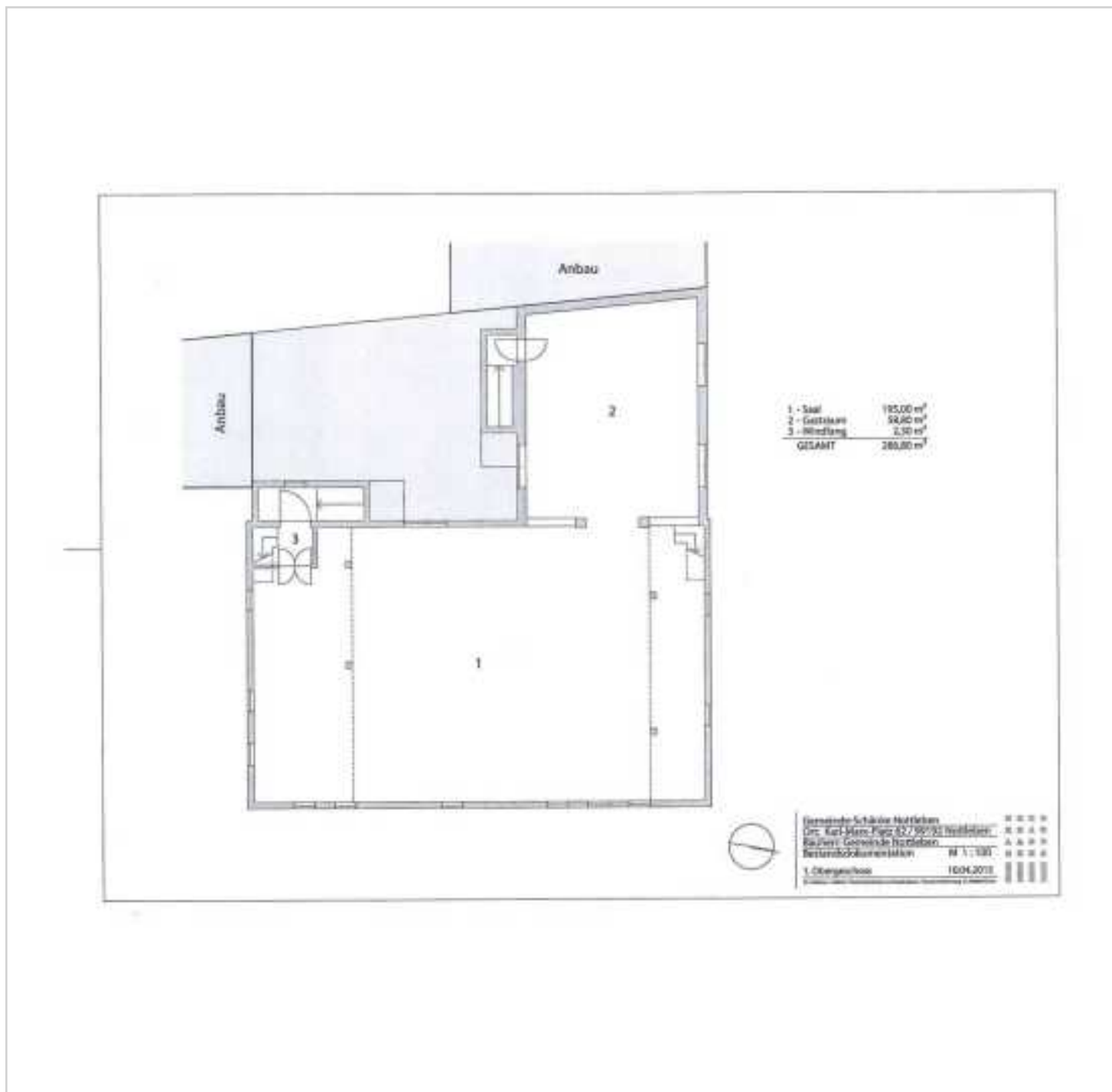
Grundriss Obere Etage

Vermarktungsart: Pacht Gastraumfläche: 73,50 m 2 Gesamtfläche: 542,90 m 2 Pachtpreis: 600,00 EUR